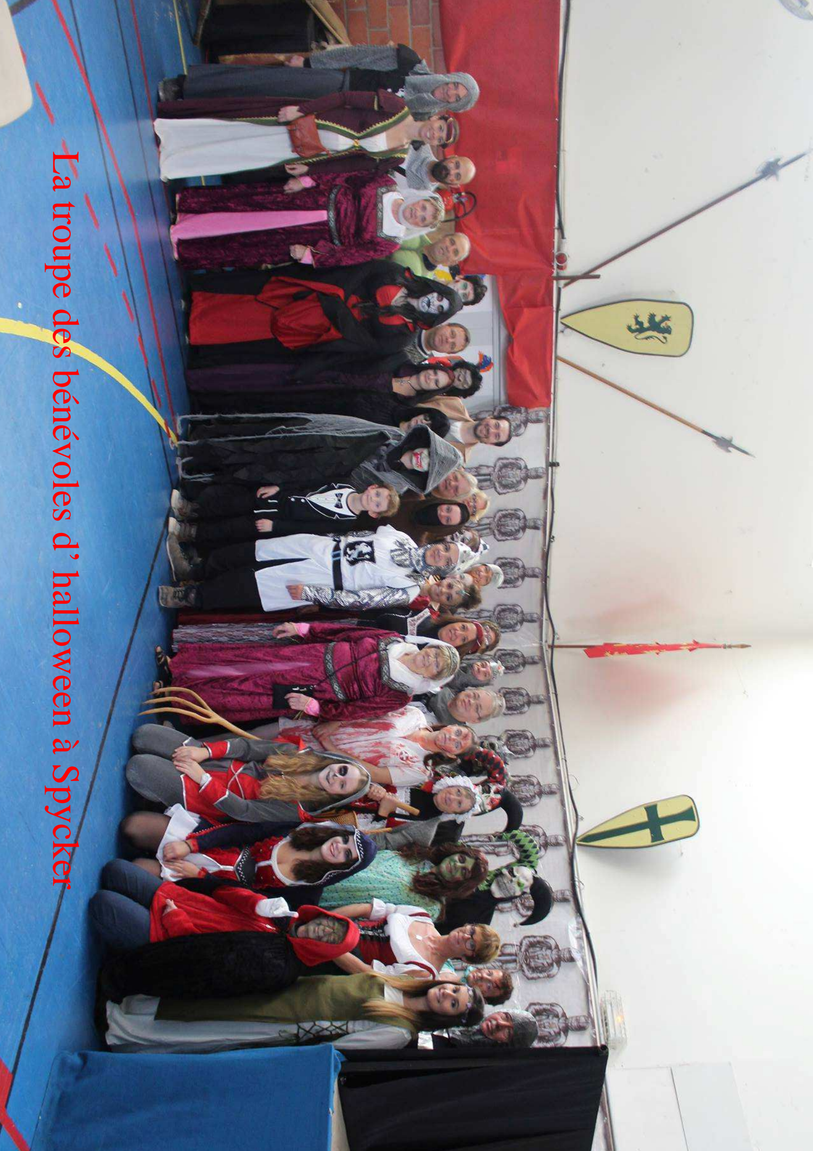
La troupe des bénévoles d'halloween à Spycker