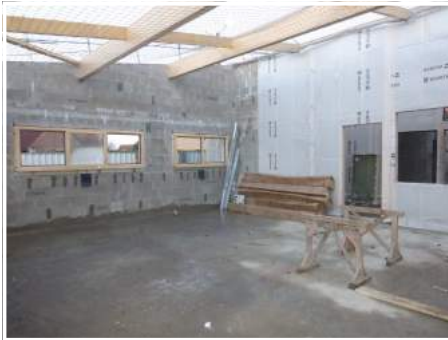
Salle de classe n° 1