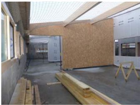
Salle de classe n° 2