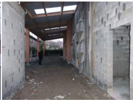
Vue de l'entrée et zone du préau