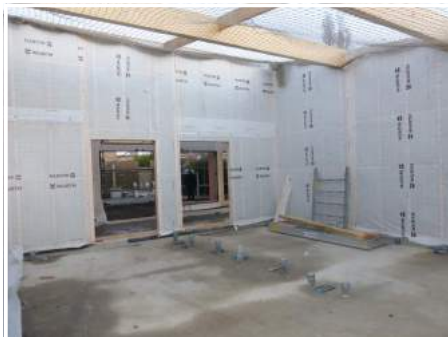
Zone sanitaires filles et garçons