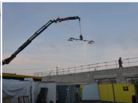
Pose de la couverture