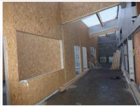
Zone activités et tisanerie