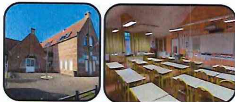
Accueil CP CE CM : Classe Ecole Élémentaire

Jeux de société Jeux de motricité Espace cuisine poupée Coin lecture Activités artistiques