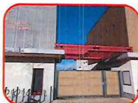
Accueil Jeunes : Local du Football