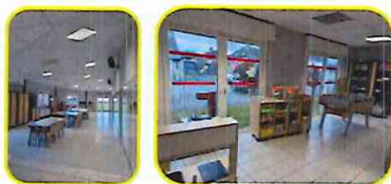
Accueil GS : Centre socioculturel

Tableau Salle de motricité Accès péricentre Cuisine (four, micro onde) Armoire avec du matériel créatif